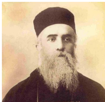
Нектарий Эгинский. Прижизненное фото

Быстрое возвышение, любовь патриарха и народа, а еще более добродетельная и чистая жизнь святителя во многих вызывали зависть и ненависть. Как говорил об этом сам святитель: «Добродетельный человек подвержен искушениям и испытаниям в этом мире», но в глубине своего сердца он радуется, ибо совесть его спокойна. Мир ненавидит и презирает добродетельных людей, одновременно, правда, завидуя им, ибо говорили наши предки: сам враг тоже восторгается добродетелью.