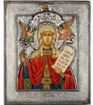
Великомученица Параскева Пятница

Слова Параскевы оскорбили правителя. Аэтий повелел разодрать на девушке одежды и бить ее сырыми воловьими жилами, а раны растирать власяницей. Пока палачи истязали Параскеву, она не проронила ни одного звука. Взирая на небо,