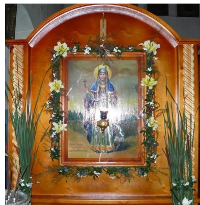
Чудотворная икона великомученицы Параскевы Пятницы из станицы Митякинской