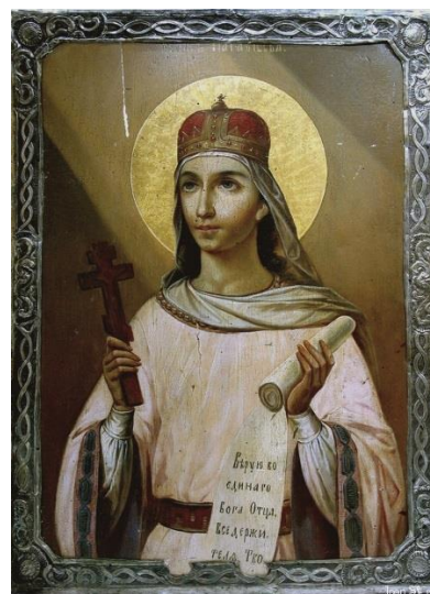
Великомученица Параскева Пятница. Икона, конец XIX века

- Будьте друзьями императора и выдайте нам всех так называемых христиан, которые не хотят приносить жертву богам.