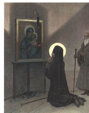
Обретение свят. Иоасафом чудотворной Песчанской иконы Пресв. Богородицы

Осенив себя крестным знаменем, пал Святитель Иоасаф пред иконою на колени и, заливаясь слезами, громко сказал: «Владычица Небесная, прости небрежность Твоих