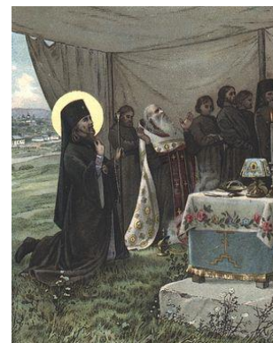
Молитва свт. Иоасафа в походной церкви за 130-ти летнего священника