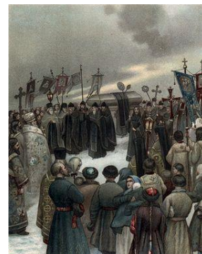
Перенесение тела усопшего свт. Иоасафа из Грайворона в Белгород

Так жил, так трудился на ниве Христовой, подвизался подвигом добрым и почил в Господе Белгородский святитель Иоасаф, великий светоч православно-христианской веры.