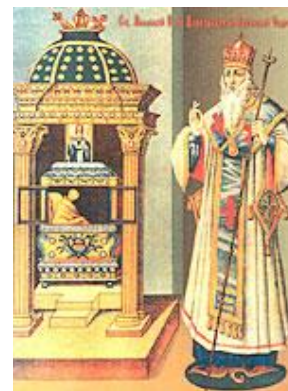
Святитель Афанасий, патриарх Цареградский и Лубенский чудотворец

Во время своего настоятельства в Лубенском монастыре игумен Иоасаф сподобился видеть два замечательных сновидения. В оба раза он видел Константинопольского