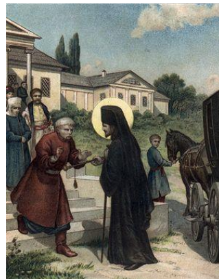
Встреча свт. Иоасафа с родными перед смертью