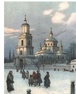
Кафедральный Свято-Троицкий собор г. Белгорода

1 января 1748 года скончался Антоний Черновский — митрополит Белгородской епархии. Св. Синод представил Ее Величеству доклад со списком кандидатов на это место. В числе кандидатов был помещен архимандрит Свято-Троицкой Сергиевой Лавры наместник Иоасаф (Горленко). 15 марта 1748 года состоялось высочайшее повеление о назначении высокопросвященного, попечительного и трудолюбивого архимандрита и наместника Иоасафа во епископа на обширную в то время Белгородскую епархию. 1 июня 1748 года благоговейный архимандрит Иоасаф был наречен, а 2 июня того же 1748 года посвящен во епископа Белгородского и Обоянского Псковским и Нарвским архиепископом Симоном Тодорским, при участии многочисленного сонма архиереев. Рукоположение архимандрита Иоасафа во епископа Белгородского было совершено в неделю всех святых, в С.-Петербургском Петро-Павловском соборе, в присутствии Императрицы Елизаветы Петровны и Высочайшей Фамилии. 6 августа 1748 года, в праздник Преображения Господня, новопоставленный святитель Иоасаф прибыл в свой епархиальный город Белгород утром ко времени Божественной литургии. Несмотря на слабое здоровье свое и изнурение далеким путешествием из С.-Петербурга в Белгород, он совершил в этот день Божественную литургию в кафедральном Свято-Троицком соборе. Так начал свое архипастырское служение великий угодник Божий святитель Иоасаф. Исполненный глубочайшего смирения и любви к Богу и ближнему, он с великой ревностью и усердием принялся за бразды архипастырского служения.