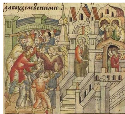
Лот с ангелами в Содоме. Летописный лицевой свод. XVI в.

Знаете, какие чудеса нам доводилось видеть по молитвам других людей? Чудеса! Перемены в людях, событиях. Молитва может изменить