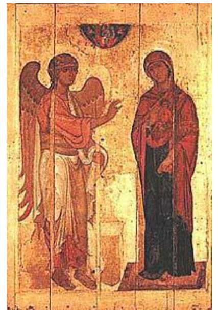
Благовещение Пресвятой Богородицы

Б лаговещение – это день благой вести о том, что нашлась во всем мире людском Дева, так верующая Богу, так глубоко способная к послушанию и к доверию, что от Нее может родиться Сын Божий. Воплощение Сына Божия, с одной стороны, дело Божией любви – крестной, ласковой, спасающей – и Божией силы; но вместе с этим воплощение Сына Божия есть дело человеческой свободы. Святитель Григорий Палама говорит, что Воплощение было бы также невозможно без свободного человеческого согласия Божией Матери, как оно было бы невозможно без творческой воли Божией. И в этот день Благовещения мы в Божией Матери созерцаем Деву, Которая всем сердцем, всем умом, всей душой, всей Своей крепостью сумела довериться Богу до конца.